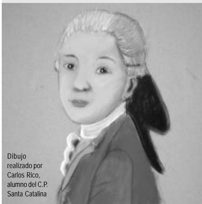
Dibujo realizado por Carlos Rico, alumno del C.P. Santa Catalina