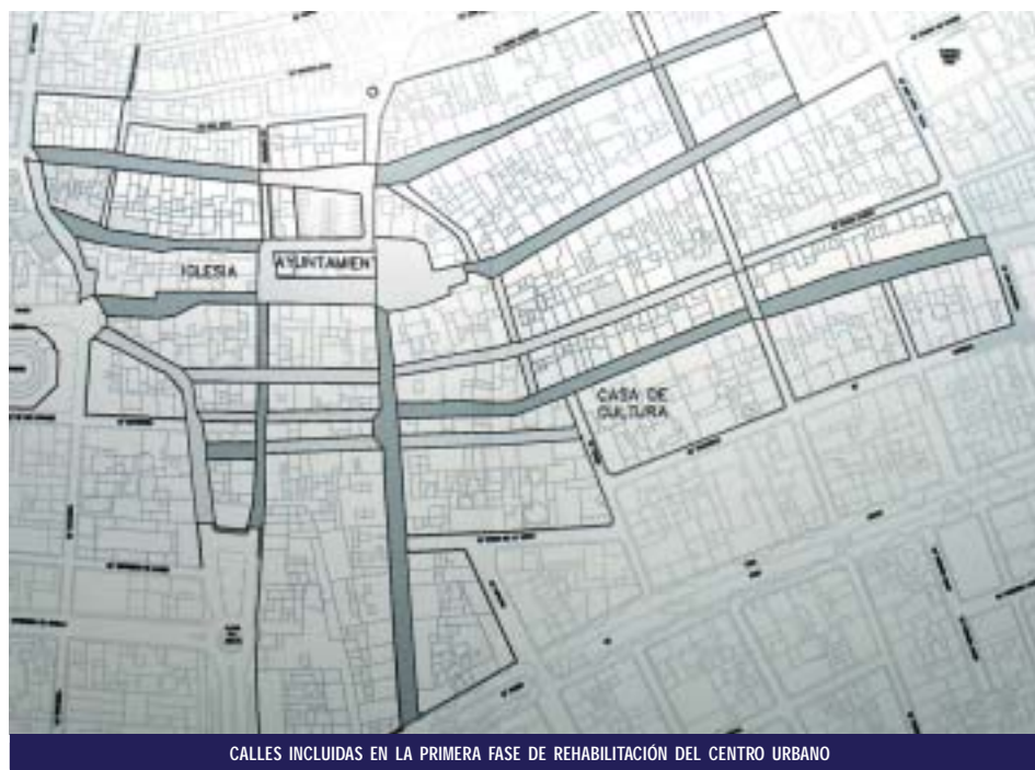
CALLES INCLUIDAS EN LA PRIMERA FASE DE REHABILITACIÓN DEL CENTRO URBANO

Con este ambicioso proyecto se pretende potenciar el atractivo urbanístico del municipio para atraer al turismo.