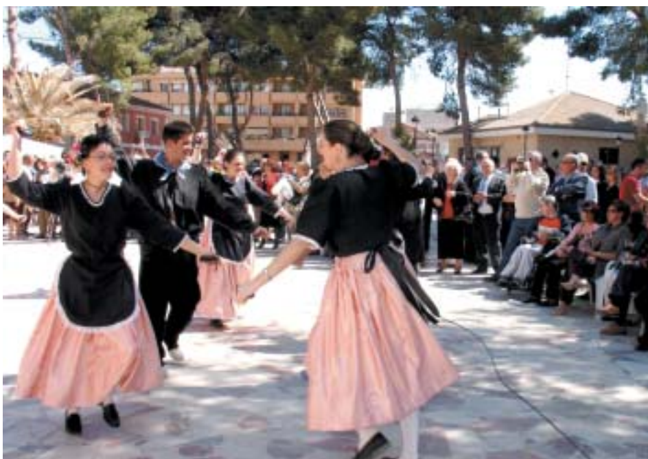
EL GRUPO DE DANZAS «MONTE DE LA SAL» AMENIZÓ LA FERIA

Hacia las 12:30 horas, los pinoseros ausentes, que celebraban su día de convivencia anual, visitaron el re-