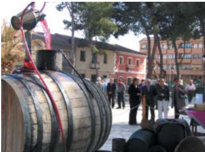
VISTA GENERAL DEL RECINTO DEL JARDÍN MUNICIPAL EL DÍA DE LA FERIA

cientes a la asociación gastronómica de productos de Pinoso, que ofrecieron a degustar sus delicias al público asistente. Además, la Concejalía de turismo y Comercio ofreció folletos de los recursos turísticos de la localidad.