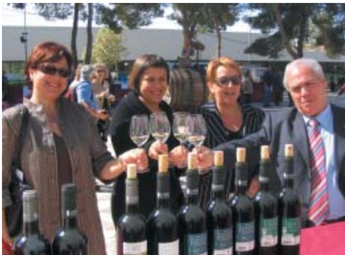
RESPONSABLES DE LA FERIA JUNTO AL PRESIDENTE DEL CONSEJO REGULADOR