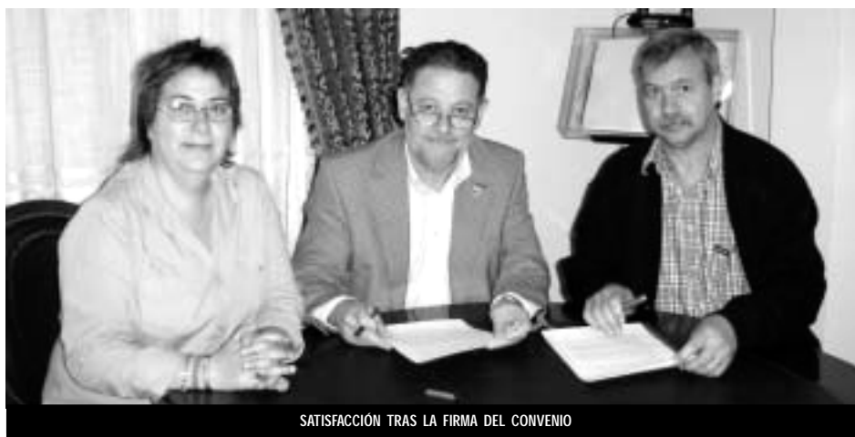
SATISFACCIÓN TRAS LA FIRMA DEL CONVENIO