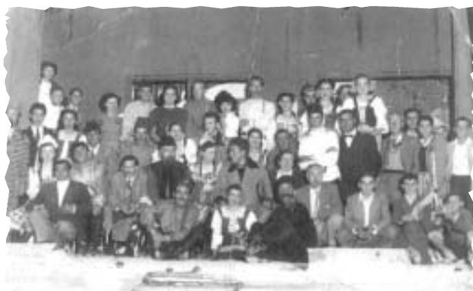
Elenco de la zarzuela "Katuska", representada en el "Cinema Colón"