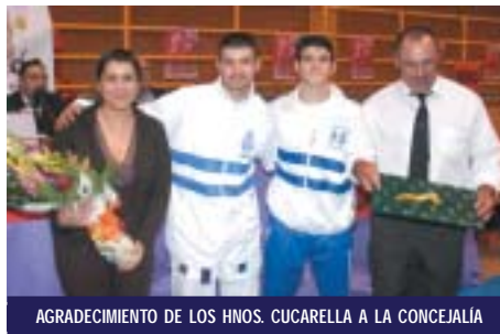
AGRADECIMIENTO DE LOS HNOS. CUCARELLA A LA CONCEJALÍA

En lo que se refiere a los árbitros, este año se contó con la presencia de Ra-