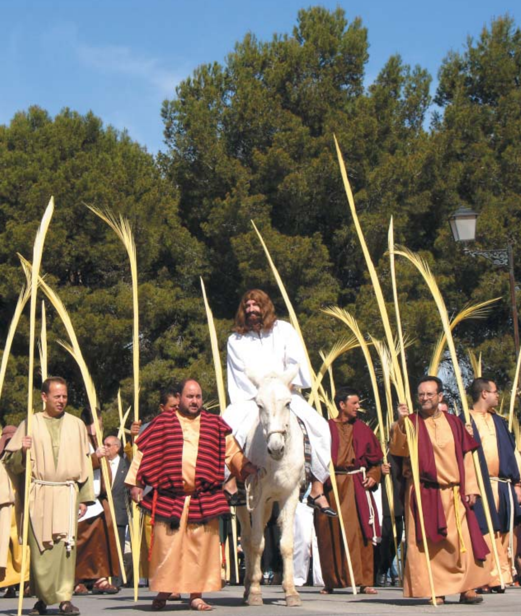
Los Apóstoles acompañan a Jesús el Domingo de Ramos